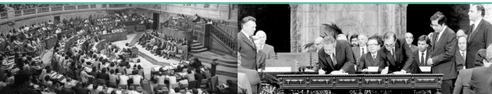
25 DE ABRIL DE 1976: ELEIÇÃO DO PRIMEIRO GOVERNO CONSTITUCIONAL

Este programa de audição deve integrar simultaneamente propostas que aproximem os partidos dos cidadãos, criação de condições para que novos movimentos cívicos possam aceder ao espaço político, e reformas institucionais capazes de aumentar a representatividade e a confiança nos partidos e instituições. Entre essas propostas podem ser destacadas a necessidade de promover um debate alargado sobre a criação de um círculo compensatório nacional que permita maior proporcionalidade do sistema eleitoral, a implementação de quotas de juventude em listas de candidatura, a criação de mecanismos positivos para partidos que promovam a renovação geracional ou ainda a execução de programas estruturados de literacia democrática em escolas, universidades e associações. Um conjunto de reformas que é fundamental colocar à discussão nos órgãos próprios do CNJ para uma tomada de posição conjunta que fortaleça a nossa democracia e coloque os jovens como protagonistas centrais.